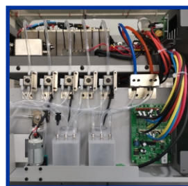
Excelente flujo de tinta y chorro estable.