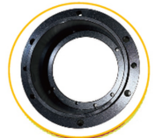
Rodamiento de alta temperatura y precisión