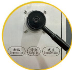
Presurizado y descomprimido